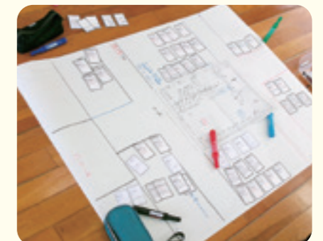
北陵中学校3年生(7月12日)

・自分とは違う人たちというイメージを持っていたが、そうではなく、みんな同じ人間で、男と女があるように性的マイノリティの人がいても何もおかしいことではなく、みんな同じなんやと思いました。