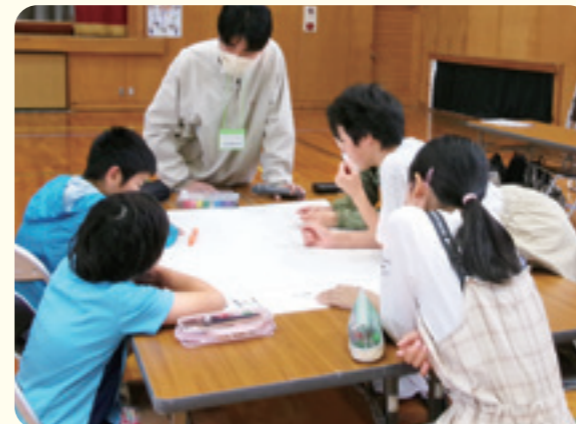
稲生小学校5・6年生(5月31日)