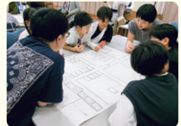
白木谷小学校5・6年生(6月21日)