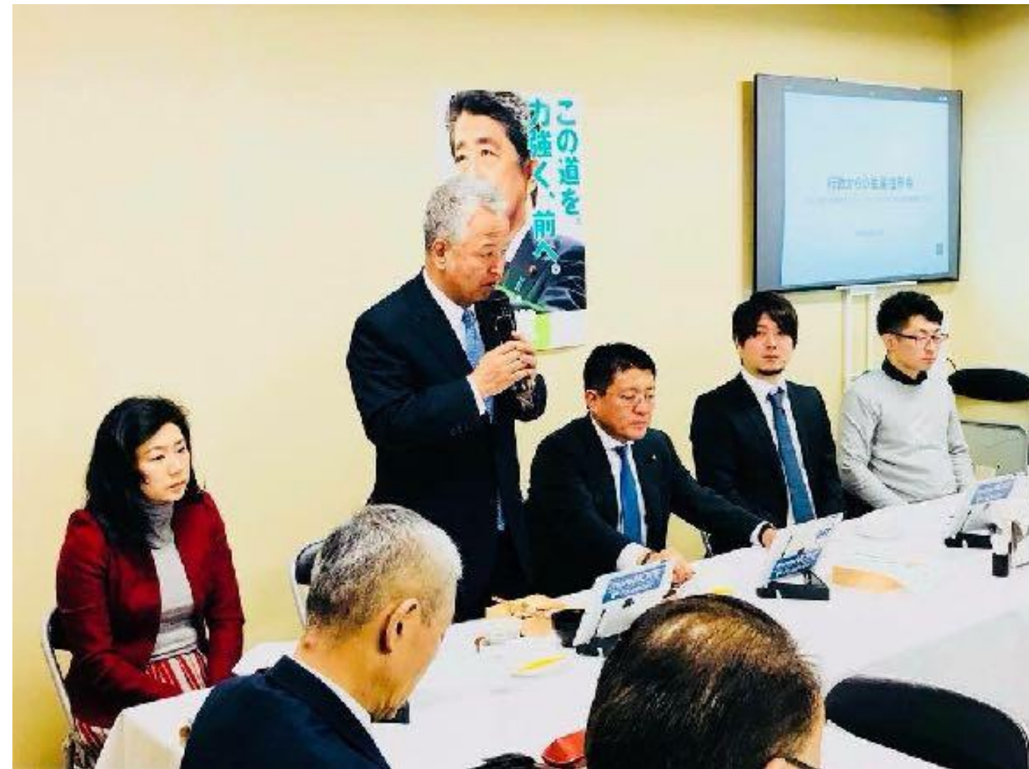
政府へのIT化戦略のご提言

日本の電子契約市場の立ち上がりを支え、政府へのIT化戦略のご提言を始めとし、電子契約の普及とともに、事業を成長させてきました。