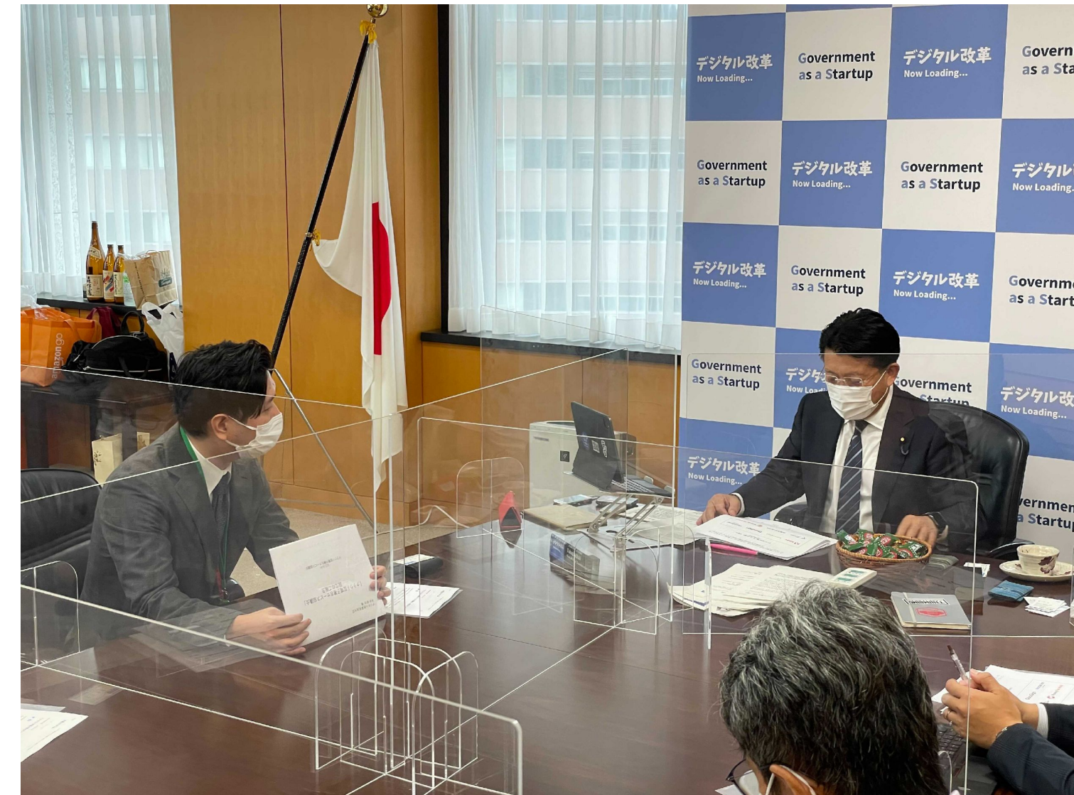
クラウド型電子署名サービス協議会の設立