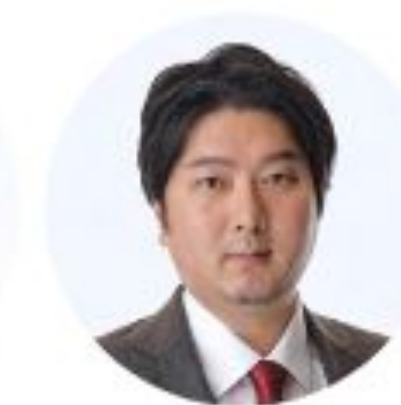
取締役 クラウドサイン事業責任者 弁護士