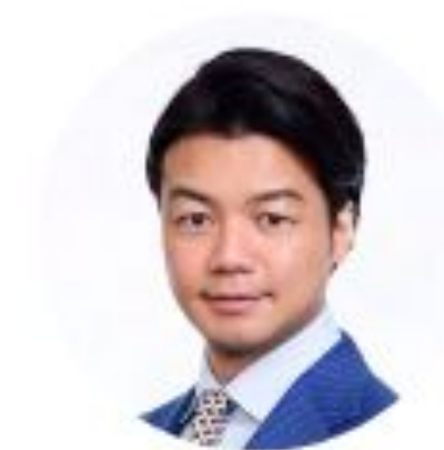
創業者 代表取締役社長 弁護士